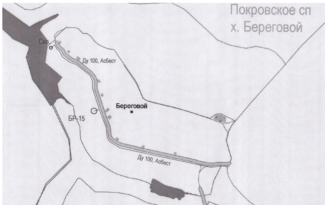
Рисунок 10. Схема сетей водоснабжения в х. Береговой

Схема существующих сетей водоснабжения в х. Береговой представлена на рисунке 10.