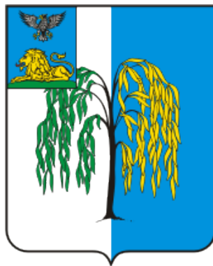
СХЕМА ТЕПЛОСНАБЖЕНИЯ Сырцевского сельского поселения муниципального района «Ивнянский район» Белгородской области на период до 2027 года (Актуализация на 2021 год)