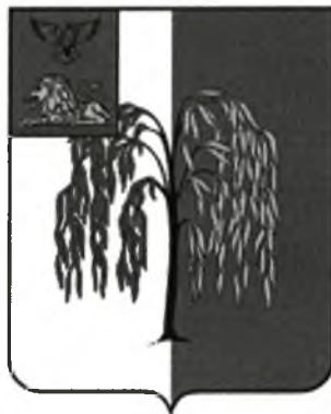
СХЕМА ТЕПЛОСНАБЖЕНИЯ Курасовского сельского поселения муниципального района «Ивнянский район» Белгородской области на период до 2027 года (Актуализация на 2021 год)

УТВЕРЖДЕНА постановлением администрации Ивнянского района 26 апреля 2021 года № 148