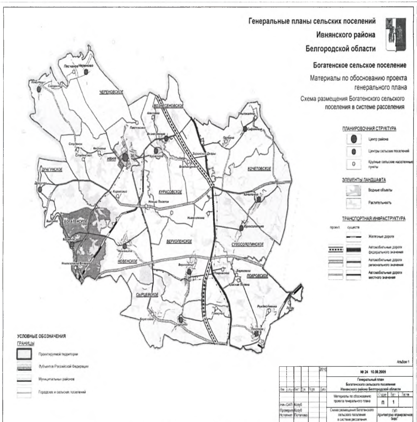
Рисунок 2. Зона действия ТКУ-0,2 Богатенского сельского поселения

Тепловые нагрузки объектов индивидуальной жилой застройки и мелких потребителей учреждений социальной защиты, образования, здравоохранения, культуры обеспечиваются от индивидуальных систем отопления. Подключение существующей индивидуальной застройки к сетям централизованного теплоснабжения не планируется.