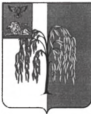
СХЕМА ТЕПЛОСНАБЖЕНИЯ Богатенского сельского поселения муниципального района «Ивнянский район» Белгородской области на период до 2027 года (Актуализация на 2021 год)

УТВЕРЖДЕНА постановлением администрации Ивнянского района 26 апреля 2021 года № 142